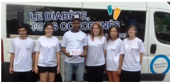
Saint-Leu – 17 juin 2015