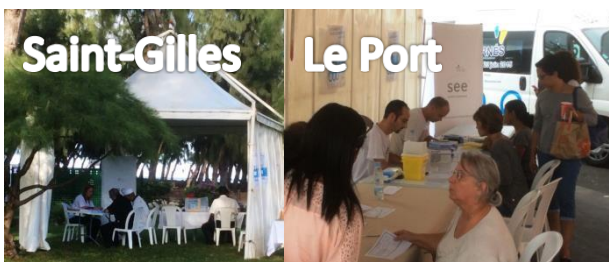
Saint-Gilles et Le Port – 19 juin 2015