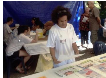
Saint-Pierre – 18 juin 2015