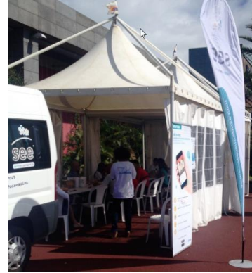
Sainte-Marie – 16 juin 2015