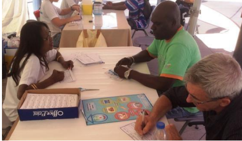
Saint-Denis – 15 juin 2015